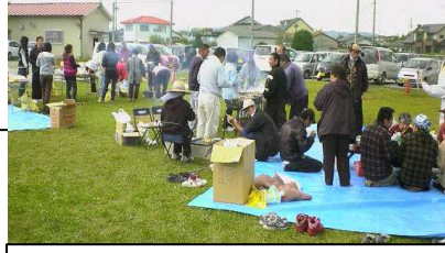
まさに黒山の人だかりでした